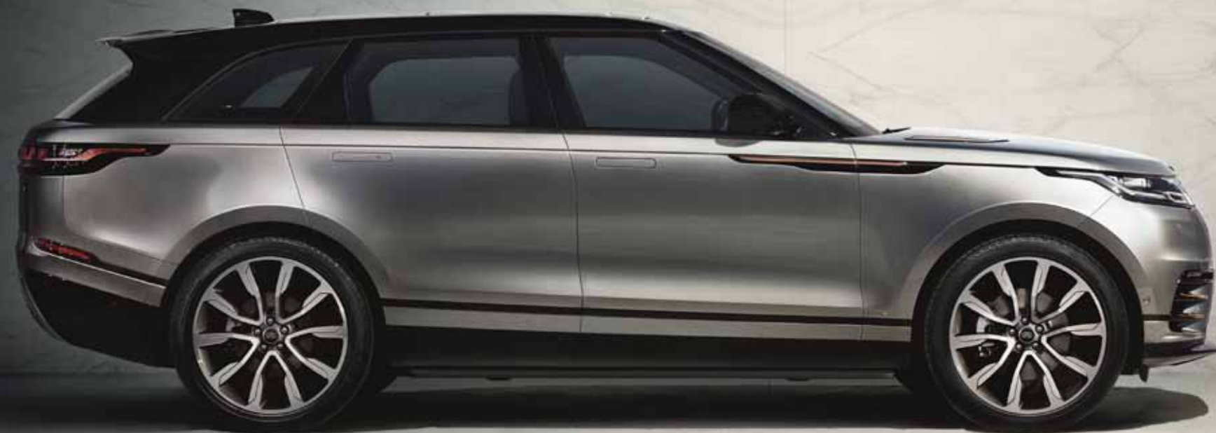
Abbildung zeigt Sonderausstattung gegen Mehrpreis.